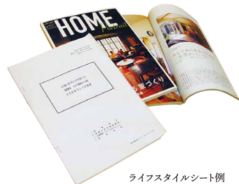
ライフスタイルシート例

FP、税理士、不動産会社、賃貸プロデュース会社、建物診断士などの信頼できる専門家と連携しています。